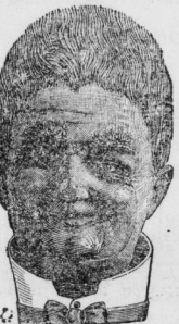
Onkel Theodor nach 14 Tagen

Diese Figur, ein Meisterstück der Keramik, besteht aus Kopf u. Kragen. In die Schildecke sind Rillen eingegraben. In die Rillen mit man Agrostisgras und füllt darauf den Kopf mit Wasser. Der Kopf ist hohl und hat oben eine Oefnung. Das Agrostisgras beginnt nun in den Rillen zu wachsen, und in kurzer Zeit ist der Kopf mit Grashaar bedeckt, welches nach und nach dunkler und von Tag zu Tag dichter wird, Onkel Theodor hat eine