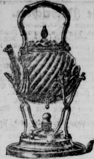
1692 1/2 K.