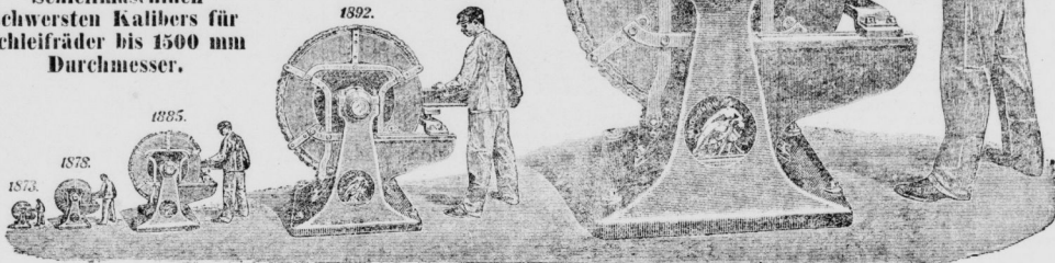
Graphische Darstellung der Jahres-Lieferungen von Schmirgel-Schleifrädern der „Naxos-Union.“

Schleifmaschinen schwersten Kalibers für Schleifräder bis 1500 mm Durchmesser.