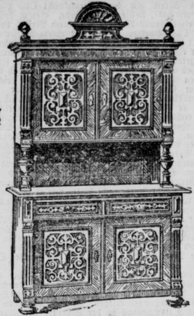
1 nussb. Buffet, innen Eiche, M. 135.

Permanente Ausstellung muster- gültiger Einrichtungen in Chippen- dale, Gotik, Empire etc.