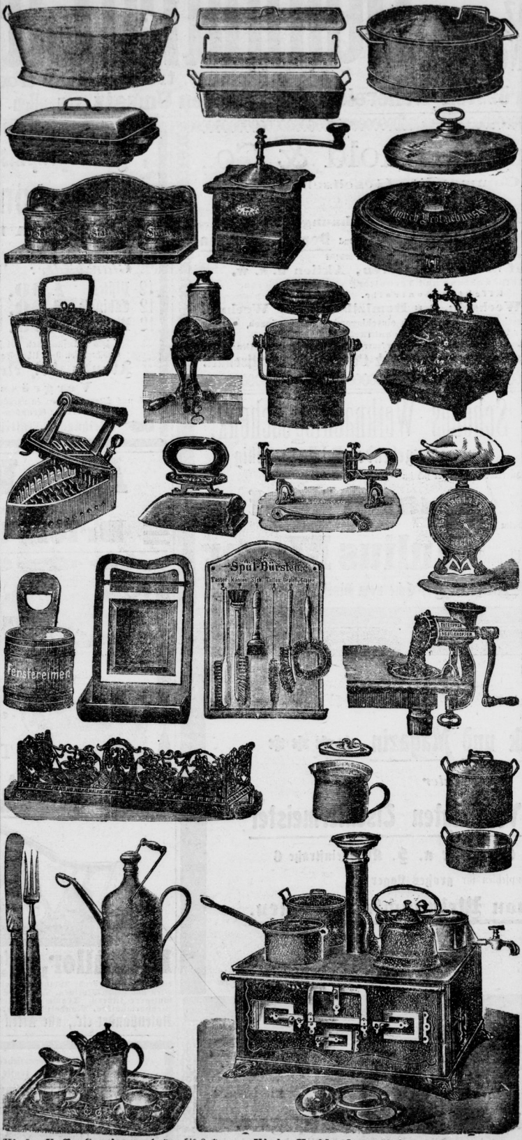
Kinder-Kaffee-Service von 1 A an bis 9 A Kinder-Kochherde von 50 A an bis 80 A

Erstes Geschäft: Leipziger Str. am Baum. Burghardt & Becher. Zweites Geschäft: Dleniusstraße am Dollmarkt.