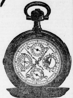
Bei Baar-Einkauf 5 Procent Rabatt.