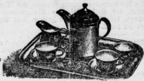
Kinder-Kaffeenservice von 1 Mark an bis 9 Mark.

in einfacher u. elegantester Ausführung.