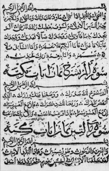
Facsimile einer Koran-Handschrift.

Ans dem Arabischen für die „Bibliothek der Gesamt-Litteratur“ neu übersetzt von Theodor Fr. Grigull. Mit Vorbemerkung und Index nebst dem Facsimile einer Koran-Handschrift. Preis geb. 1,75 M., Leinenband 2 M., Geschenkbild 2,50 M.