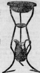
Wachsgarnitur, komplett mit email. Gefäß. Zahl n. 2 W. 50 Pf. an.

Zweites Geschäft: Oleariusstr. (an der Halle). Fernnr. 1226.