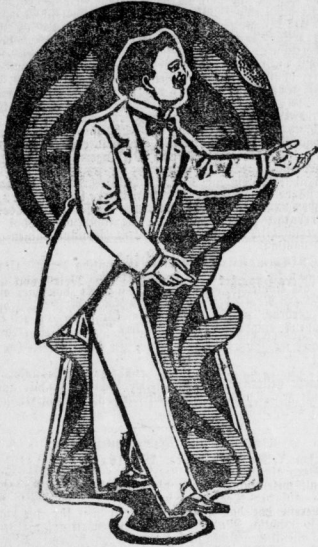
Vor Nachahmung gewarnt.