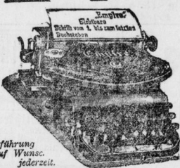
Vorfahrung auf Wunsch jederzeit.