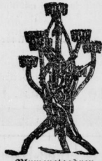
Blumensträuße aus entworfenen Eisen- stühlen.