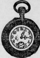
14 karat Goldene Damen-Uhren 50—210 Mk.

Weihnachts-Geschenke: Grösstes Lager am Platze in modernen Neuheiten.