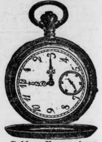
Goldene Herrenuhren Doppeldackel mit 1. Qual. Präzisionswerken 70 Mark bis 500 Mk.

Glashütter Uhren. Spezialkatalog gern zu Diensten.