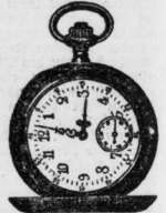
Glashütter Damen-Uhren 200—400 Mk.