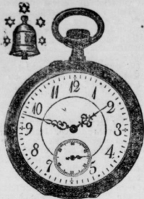
Goldene Herrenuhren mit 1. Qual. Präzisionswerken 40 Mark bis 400 Mk.

Silberne Herren-Uhren v. 14—60 M. Metall-Herren-Uhren v. 8—15 M.