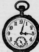
Silberne und Metall von 10 Mk. bis 25 Mk.