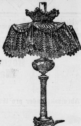
Höhe 85 cm, mit Spitzensehirm, complet Mk. 23,—.