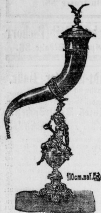
Truben, Hoeker, Bänke, Papierkörbe.

Kunstgewerbl. Weihnachts-Ausstellung, unübertroffen Kronleuchter, Hängelampen, Säulenlampen, Ständerlampen, Candelaber, feine Auswahl.