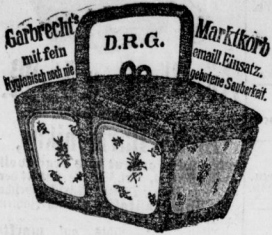
Markkork mit emaillem Einfaß in verschiedenen Größen und Ausführungen. (Weicht wie jeder andere Kork.)

Empfehle als geeignete Festgeschenke in nur vorzüglichsten Qualitäten zu soliden Preisen: Kronleuchten in nur geschmackvollen neuen Mustern 30-50 Mark, Dängelampen, Gabelker, Säulenlampen, Klavierlampen 6-12 Mark, Tischlampen, Wandleuchten, 2- und 4 armig, Paar 10-30 Mark, Seitenstränge 16 Mark, Lufttommoden 10-12 Mark, Aufputzlichter, 1-, 2- und 3 heilig, mit und ohne Schranke, Tischstränge, 1- und 2 heilig, Eisenleuchten, Treppenstränge, Gasstränge, Wäscherollen 40 Mark, Waschmaschinen, Brinnmaschinen mit nur besten Garantie-Näßen, Gardinenhänger „Deat“, 2 u. 3 Mark, 1250 Mark, Kohlenkästen, mit feinen Malereien 3-20 Mark, Tischschirme, 1- und 3 heilig, 4.50-25 Mark, Eisenreiger 2.50-25 Mark, schmiedeeiserne Vinnenröhre 12-50 Mark, schmiedeeiserne Käfigtücher, Vogelkäfige mit Glascheiben 3-27 Mark, Kabaerhänder, schmiedeeiserne Kleiderstränge zu 50, 100, 200, 300 Blenden etc., Vorhänge mit Seinstoff-Einfaß, Gemälde-Gängern in ravelnden neuen Formen und Mustern.