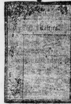
Verschönerung meiner umfangreichen, mit vielen Neuheiten ausgestatteten Ausstellung jederzeit gern gestattet.