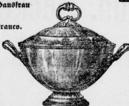
Suppenzuginen mit Deckel von 1-7 Lit. Inhalt.