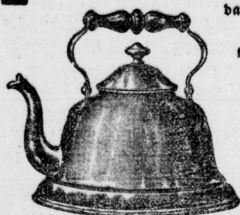
Wasserkessel mit Einfaß oder flachen Boden u. 1-6 Lit. Inhalt.