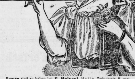
Loose sind zu haben bei E. Heinzel, Halle, Zwingstr. 9, part.

Ziehung in Cassel am 16. u. 17. September Hauptgewinn: Mark 50,000 zus. 4874 Gewinne W. 150,000 Mark Nur 1 Mark für 1 Loos (11-10 Mt.) Porto u. Liste 20 Pfg. Loos-Versand auch geg. Coupons u. Briefmarken. CARL HEINTZE Berlin W., Unter den Linden 3.