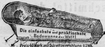
Die einfachste und praktischste Badewanne der Welt!

Preis 40 Mark mit Schweißeinrichtung 62 Mk.