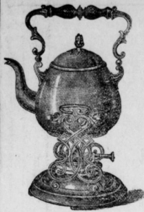
Theemaschine in Nickel und Kupfer.