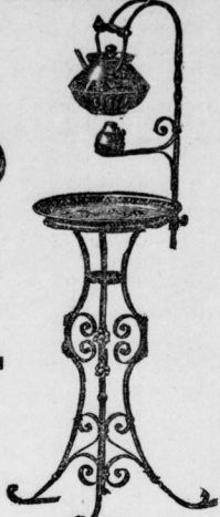
Theetisch Schmiedeeisen mit edel Kupfer oder ganz vernickelt.