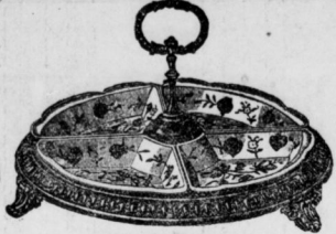
Cabaret-Menage in Nickel und ff. Holzgefäß.