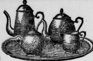
Reinmetall und nickelplattirte Kaffee- und Thee-Service in garantirt nur bester Qualität, sowie einzelne Kaffee- u. Theebekannen, Zuckerdosen, Sahneingießer in verschiedenen neuen Facons.