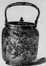
Biscuitmaschine in Nickel-Crystal und Fayence.