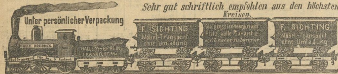
Sehr gut schriftlich empfohlen aus den höchsten Kreisen.

Ihre Anfertigung nach Maß halte mein mit allen Neuheiten der Saison angefertigtes Stoff-Lager unter Garantie tadelloser Ausführung bei billigsten Preisen bestens empfohlen.